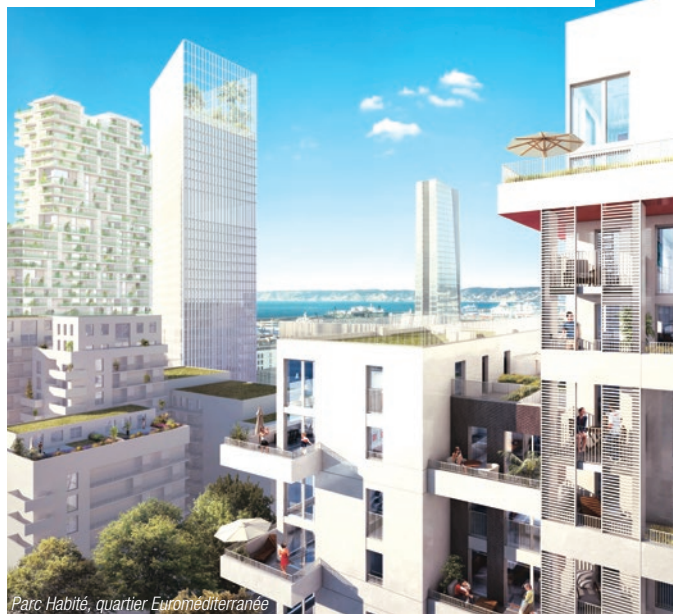
Parc Habité, quartier Euroméditerranée