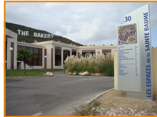
Le siège à Gémenos de The Bakery avec un petit clin d'oeil à Hollywood...